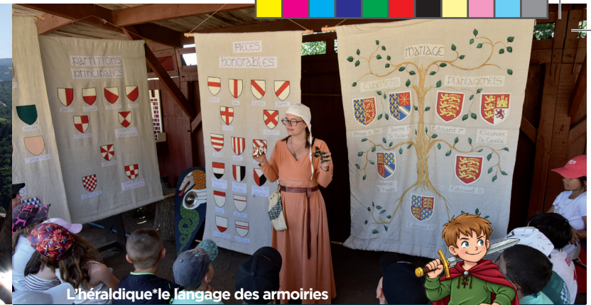
L'héraldique*Le langage des armoiries