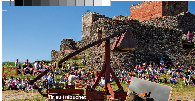
Tir au trébuchet