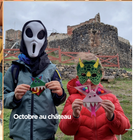
Octobre au château