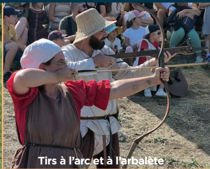
Tirs à l'arc et à l'arbalète