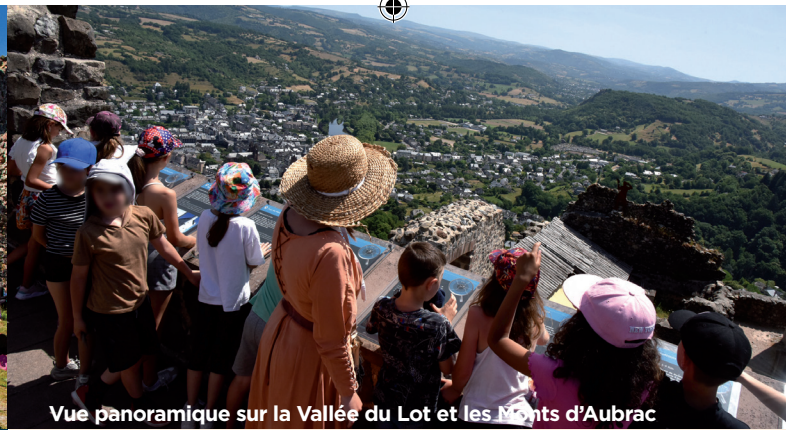
Vue panoramique sur la Vallée du Lot et les Monts d'Aubrac