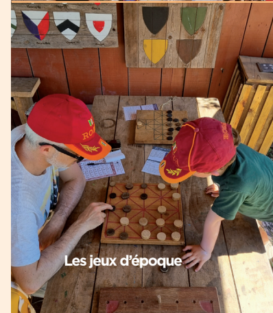
Les jeux d'époque